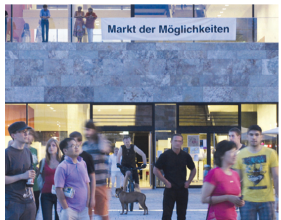
Im Herzen des Geschehens: das neue Hörsaalzentrum mit grandiosen Ausblicken und dem ‚Markt der Möglichkeiten‘ sowie der große Campusplatz mit der Open-Air-Mensa des Studentenwerks und durchgängigem Musikprogramm.